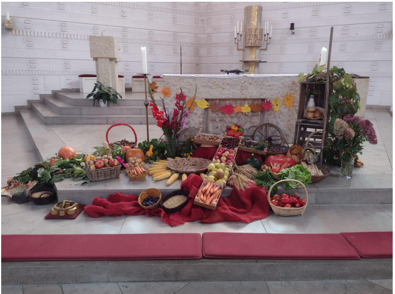
Erntedankaltar 2022, Grund- u. Mittelschule Kirchenthumbach